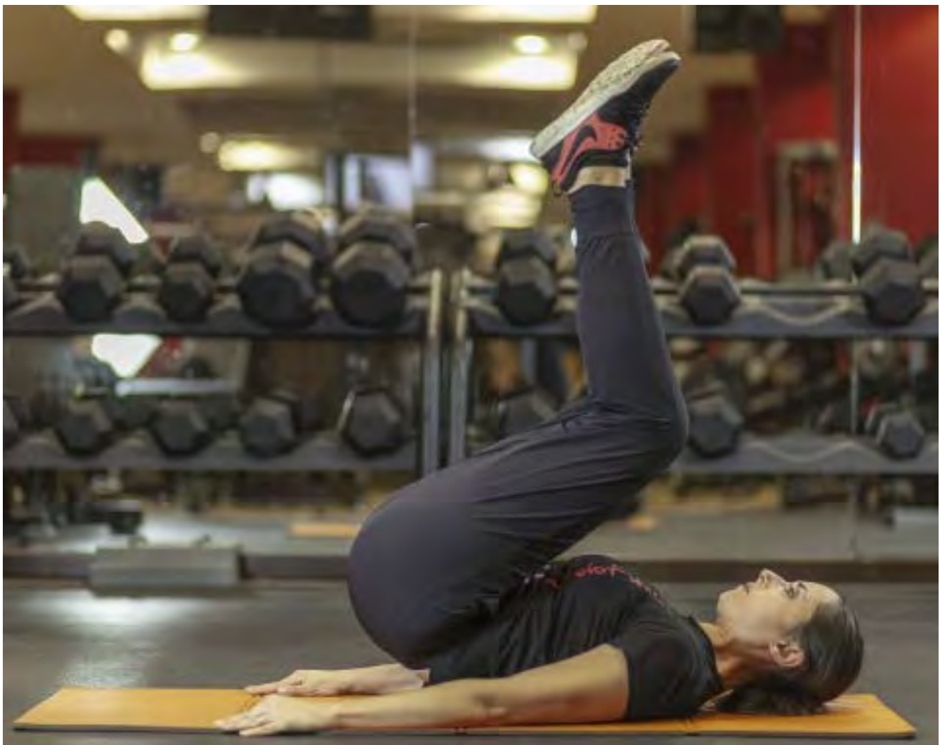
ESERCIZIO CRUNCH INVERSO

Ancora una volta il focus è la retroversione del bacino, cartina tornasole della bontà esecutiva dell'esercizio.