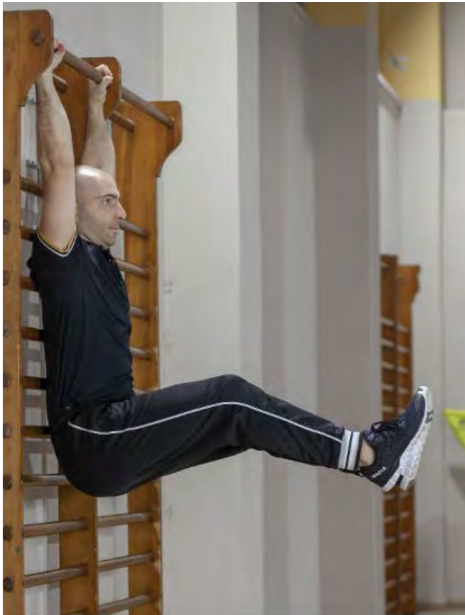
ESERCIZIO LEG RAISE, FASE INIZIALE DEL MOVIMENTO