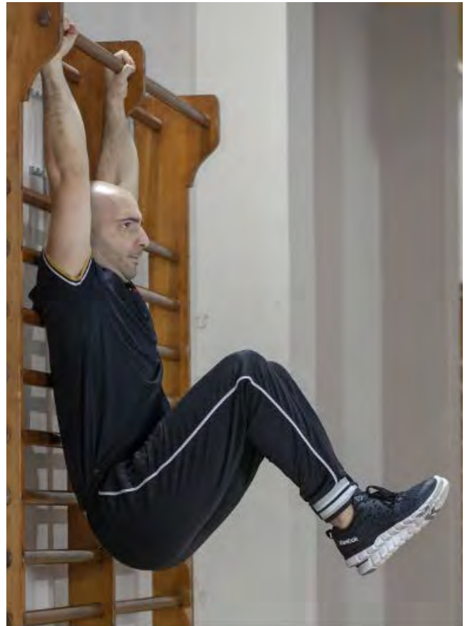
ESERCIZIO LEG RAISE, FASE FINALE DEL MOVIMENTO